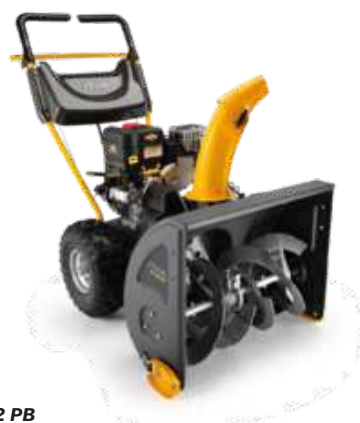
ST 3262 PB