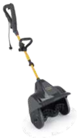
ST 1131 E