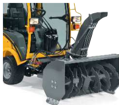
Двухступенчатый снегоуборщик с гидравлическим приводом, рабочая ширина — 112 см, зубчатый шнек, гидравлическая регулировка направления и расстояния выброса снега с желоба. Вес — 170 кг.