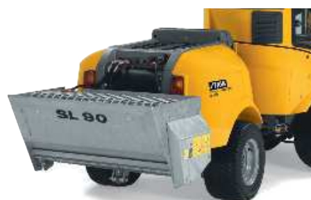
Оцинкованный разбрасыватель песка или удобрений электрический привод, ручная регулировка, объем — 120 л, ширина разброса — 90 см. Вес - 80 кг.