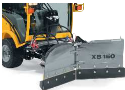
Нож-снегоотвал, рабочий угол которого регулируется двумя гидравлическими цилиндрами, рекомендуется для узких проходов, имеет 4 положения, рабочая ширина — мин. 133 см/макс. 155 см. Стальная накладка в комплекте. Вес — 144 кг.