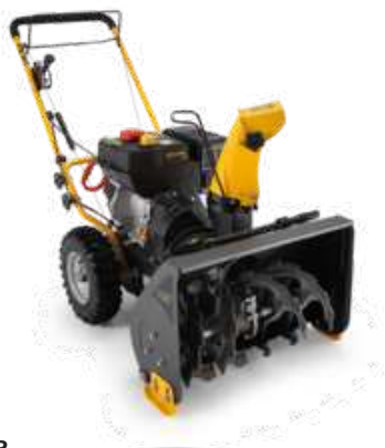
ST 3255 P