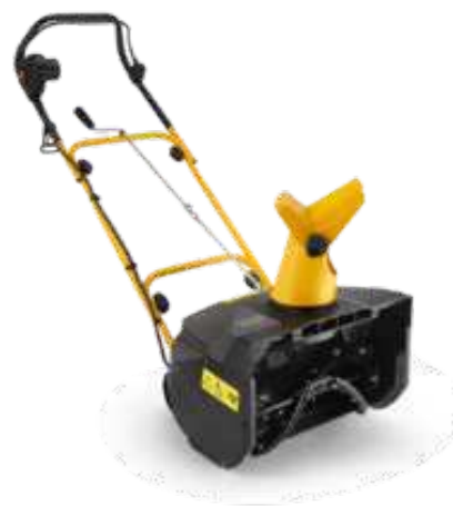
ST 1145 E