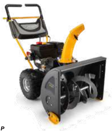
ST 3262 P