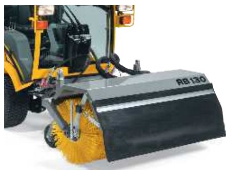
Щетка с гидравлическим приводом подходит для уборки пыли и снега. Регулируемые вручную опорные колеса, щетка шириной 130 см, вес — 135 кг.