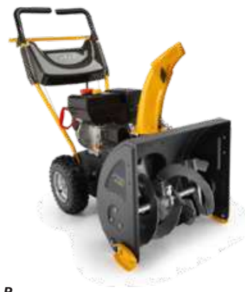
ST 3256 P