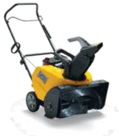
SNOW PRISMA BASIC