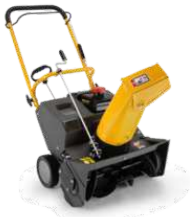
ST 1151 P