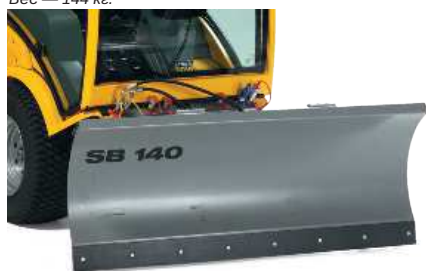
Нож-снегоотвал с гидравлическим приводом, регулируемые опорные лыжи, пружинная система безопасности, ширина — 130 см, стандартная стальная накладка, вес — 90 кг.