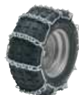
Цепи противоскольжения 17"