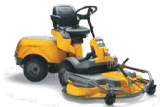
PARK 540 LPX