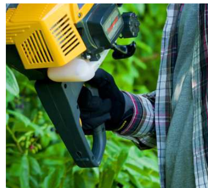
Все управление устройством сосредоточено на рукоятке для полного контроля и удобства работы с кусторезом.