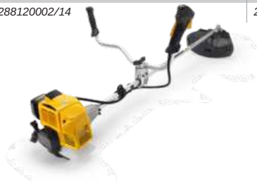
SBC 635 KD