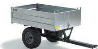
Гальванизированная тележка Pro