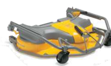
ДЕКА PARK 110 C PRO