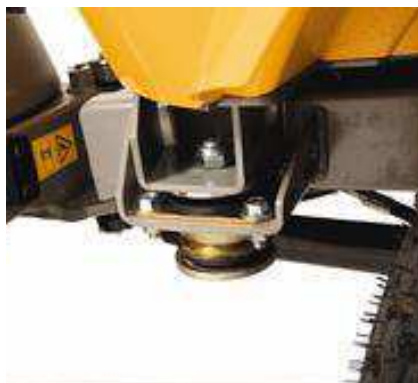
Повышенная шумоизоляция корпуса обеспечивает низкий уровень шума и комфорт при работе.