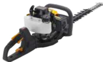
SHT 660 K