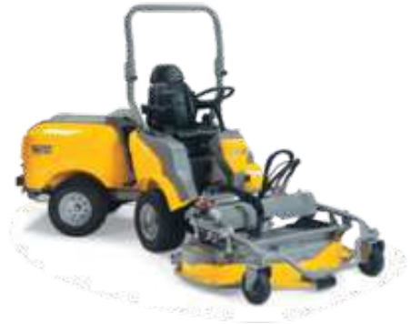
TITAN 540 D