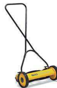
DINO 47 B