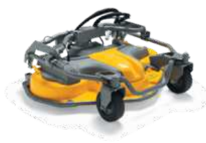
Режущая дека RM125H Combi