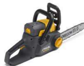
SC 436 QA