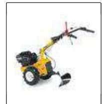
Плуг для Silex 95.