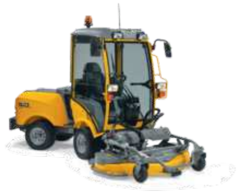
TITAN 740 DC