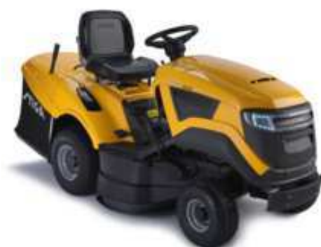
ESTATE 5092 H