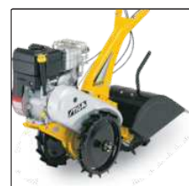
Задняя фреза 32 см с железными колесами для Silex 103.