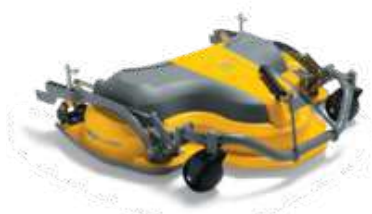
ДЕКА 100 COMBI 3 EL