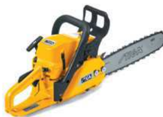
SP 46 (18")