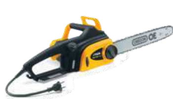
SE 180 Q