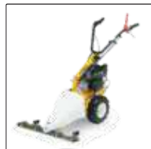
Газонокосилка 87 см для Silex 95.