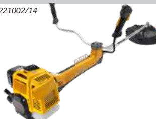
SBC 653 KD