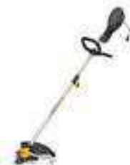
SB 1000 J