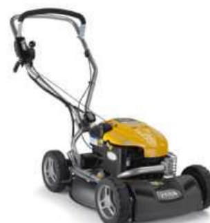
MULTICLIP 50 S B