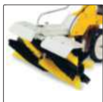
Фронтальная щетка 105 см