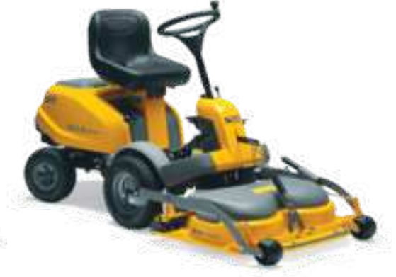
VILLA 14 HST