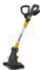
SGT 2220 A