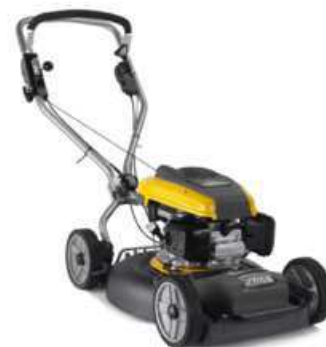
MULTICLIP PRO 50 S SVAN