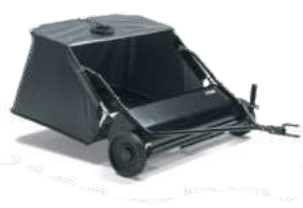
Бункер для травы и листьев