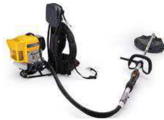
SBC 645 KF