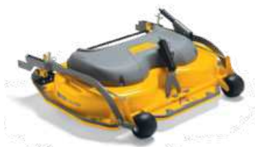
ДЕКА PARK 105 C