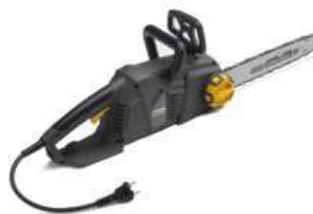
SEV 2416 Q