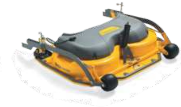
ДЕКА VILLA 105 C EL