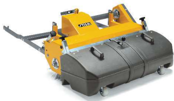
Щетка с бункером