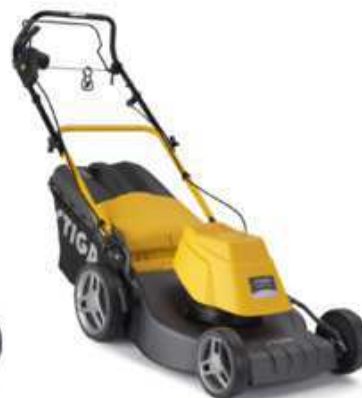
COMBI 40 AE Plus