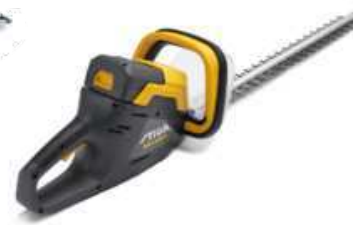
SHT 436 A