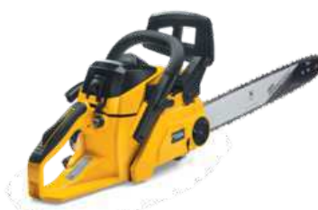
SP 375 Q