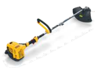
ST 28 J