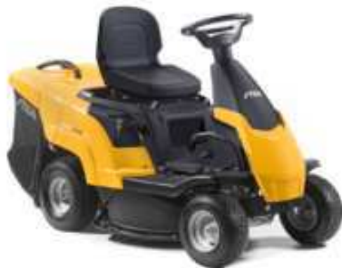
COMBI 1066 H