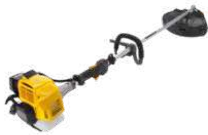
SBC 627 K