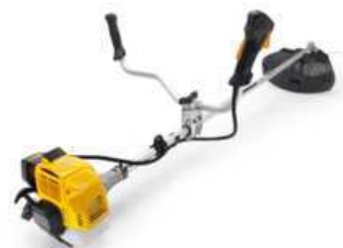
SBC 627 KD