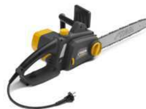
SE 2016 Q