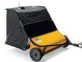
Бункер для травы и листьев 42"