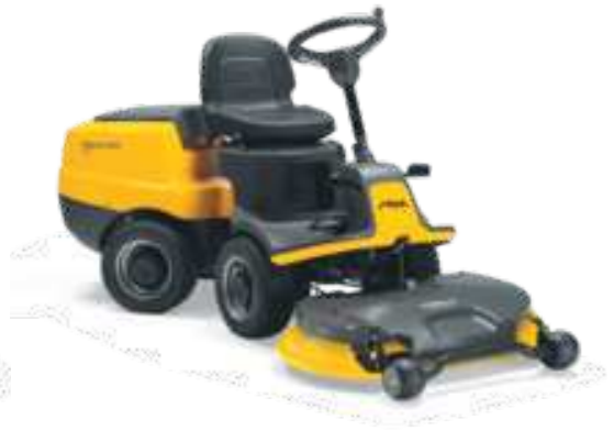
VILLA 520 HST