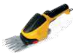
SGS 60 LI