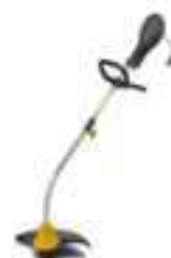
SGT 1000 J