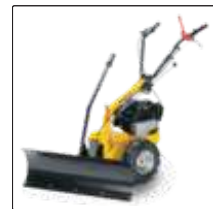
Нож-снегоотвал 85 см для Silex 95.