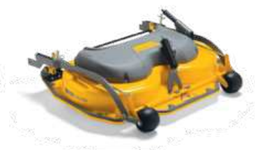
ДЕКА VILLA 95 C