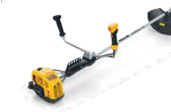
SB 33 D