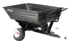
Пластиковая тележка Combi