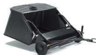
Бункер для травы и листьев 38"