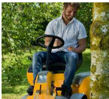
Удобное сиденье, доступные элементы управления.

Расположены впереди и позади режущей деки. Защищают от срезания грунта на неровных поверхностях.