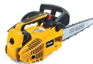
SPR 255 C