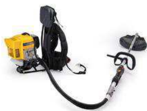
SBC 653 KF