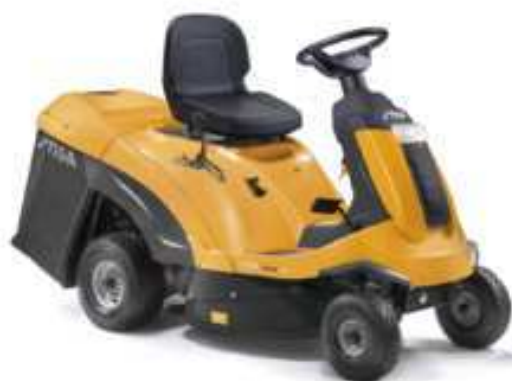
COMBI 3072 H