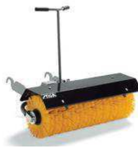
Щетка Villa 300-500