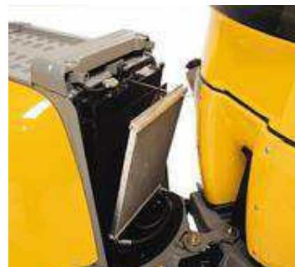
Усовершенствованная система охлаждения двигателя и гидравлической системы. Простота очистки!