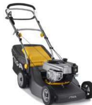
TURBO PRO 50 S B