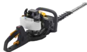
SHT 675 K