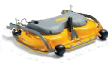
ДЕКА PARK 105 C EL