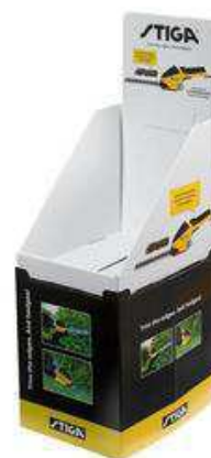
Картонная упаковка 117440713/0