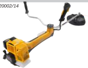
SBC 645 KD