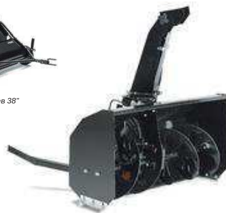
2-х ступенчатый снегоотбрасыватель Park Pro