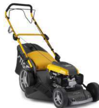
COMBI 48 SQ