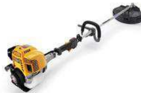
SBC 425 H