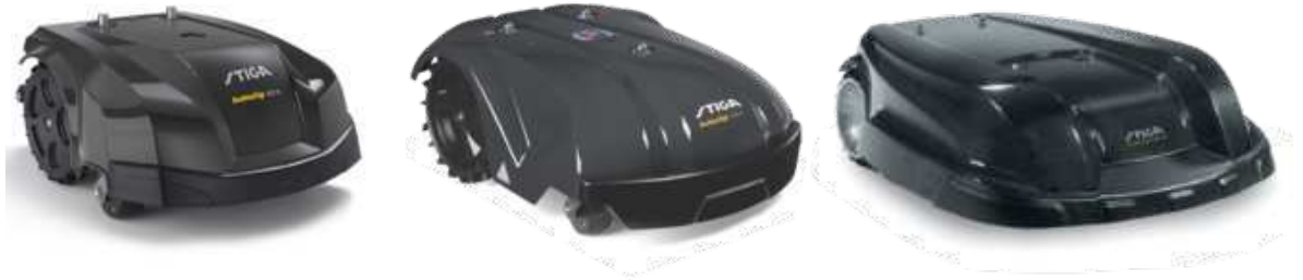
AUTOCLIP 527 S