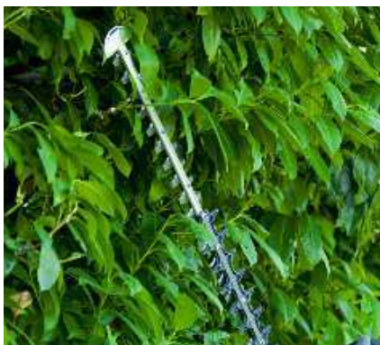
Нож для эффективной резки густых изгородей.

Рукоятка поворачивается на 180° для удобной работы при вертикальной и горизонтальной резке.