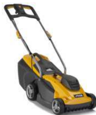
COLLECTOR 34 E