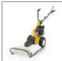
Сенокосилка 53 см для Silex 95.