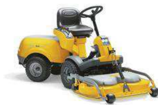
PARK 740 WX