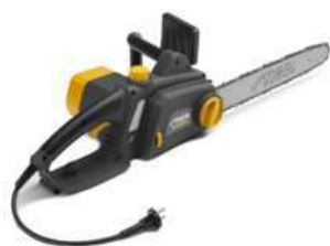
SE 2216 Q