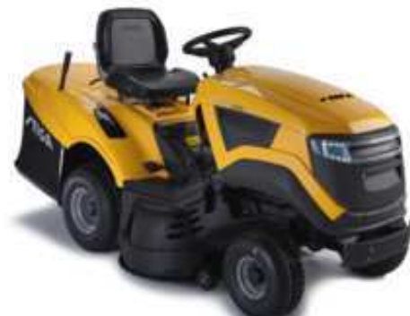
ESTATE 5102 H