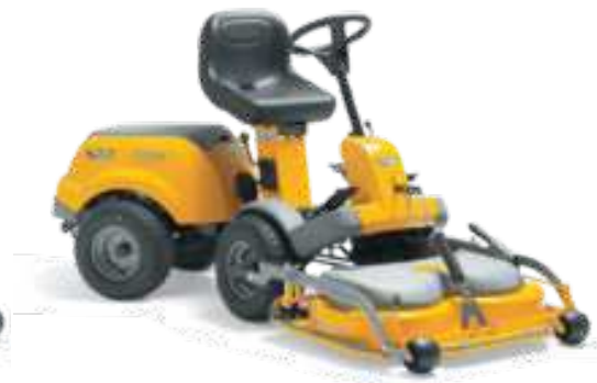
PARK COMPACT 14