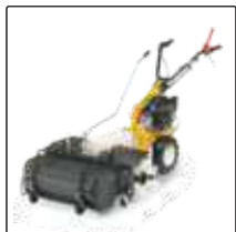
Фронтальная щетка 82 см с бункером для Silex 95.