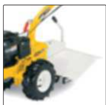
Задняя фреза 50 см для Silex 95.