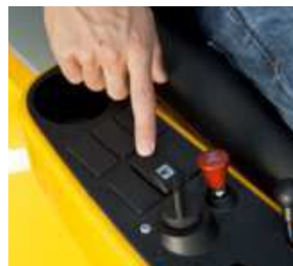
Простота управления с гидравлическим устройством для подъема оборудования. Четыре положения оборудования: верхнее, обычное, нижнее и «плавающее».