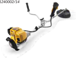
SBC 435 HD