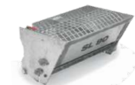
Разбрасыватель песка SL90