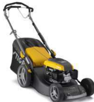
TURBO 48 S B