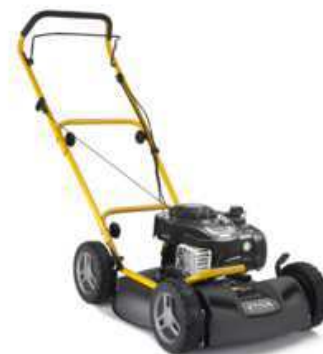
MULTICLIP 50 BLUE