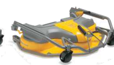
ДЕКА PARK 110 C PRO EL