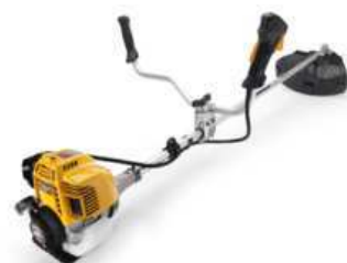
SBC 425 HD