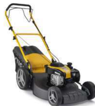
COMBI 48 S B