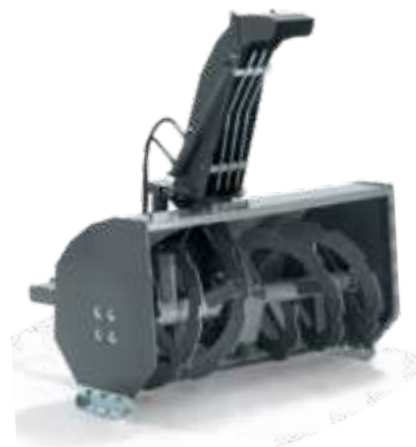
2-х ступенчатый снегоотбрасыватель ST110