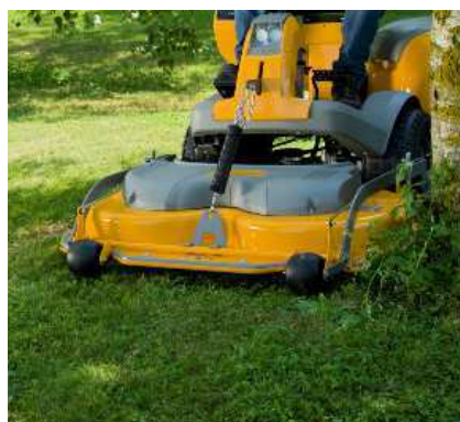
Расположенная спереди режущая дека Combi обладает шириной до 125 см издает лишь легкое жужжание при работе.