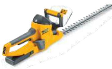
SHT 5224 A