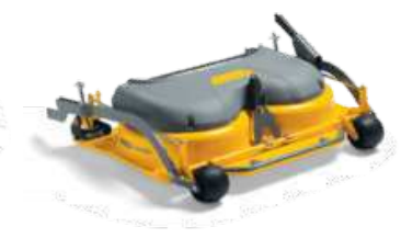
ДЕКА 78 C MULTICLIP