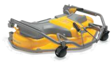
ДЕКА PARK 125 C PRO