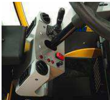
Улучшенные характеристики отопителя.

Обеспечивают повышенную силу тяги и оптимальный по эксплуатационным характеристикам полный привод.