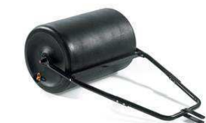
Каток для сада