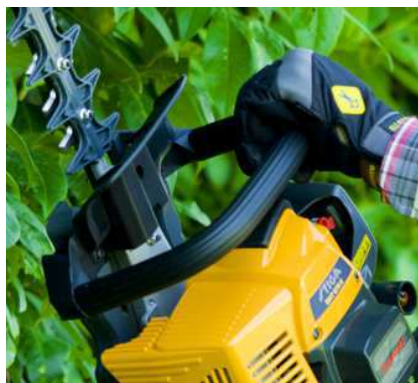
Большая передняя защищенная рукоятка обеспечивает удобство и безопасность работы оператора.