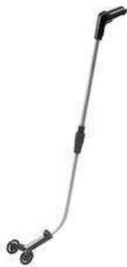
Телескопическая рукоятка с колесами 232520000/13S