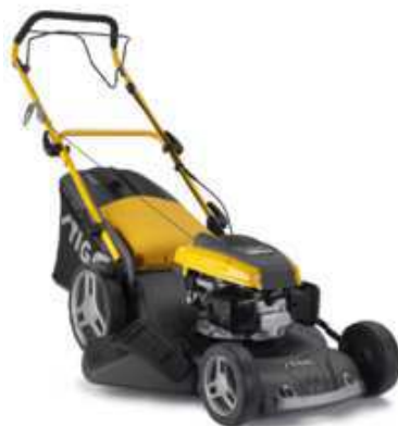
COMBI 53 SQ H