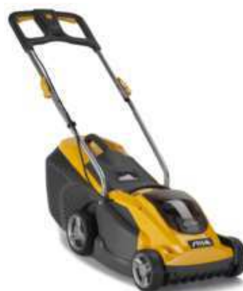
COMBI 40 E