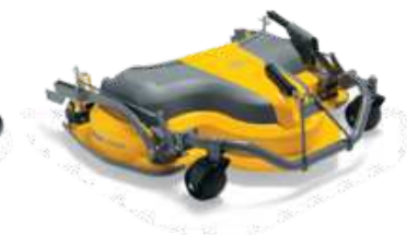
ДЕКА 100 COMBI 3