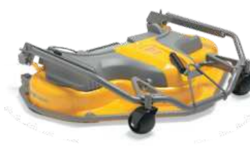
ДЕКА PARK 125 C PRO EL