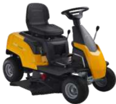
TORNADO 1066 H