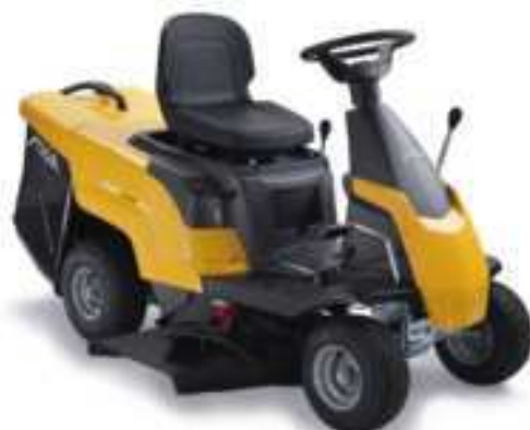
COMBI 1066 HQ