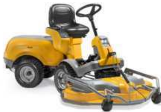
PARK 520 L