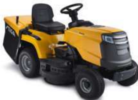
ESTATE 3384 H