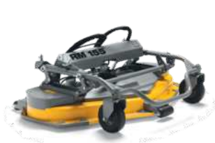
Режущая дека RM155H DOD