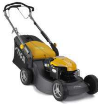
TURBO 53 S4Q H