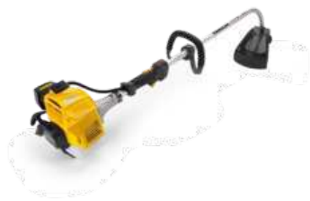
SGT 627 K