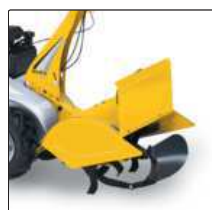
Плуг для Silex 103.