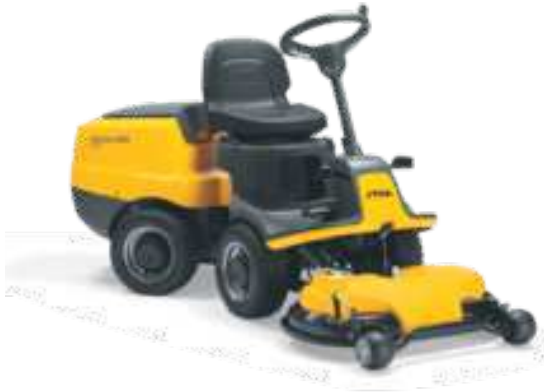
VILLA 320 HST