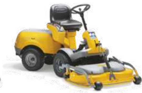
PARK 620 W