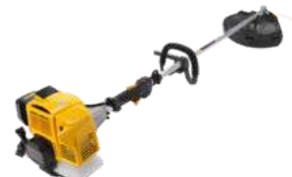
SBC 645 K