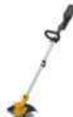
SGT 436 A