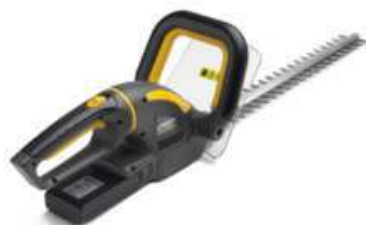
SHT 4620 A