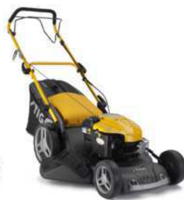
COMBI 53 SQ