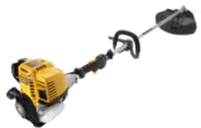
SBC 435 H