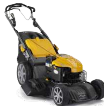
EXCEL 50 S4Q B