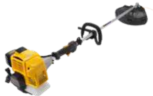
SBC 635 K