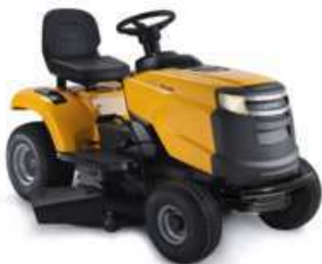
TORNADO 2098 H