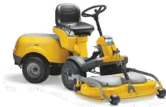
PARK COMPACT 16 4WD