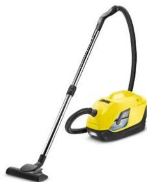
DS 5.800 Waterfilter

Отдельные детали водяного фильтра быстро и легко очищаются струей воды из крана.